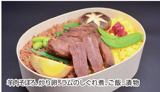
羊肉そぼろ、炒り卵、ラムのしぐれ煮、ご飯、漬物