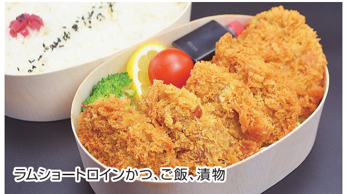
ラムショートロインかつ、ご飯、漬物