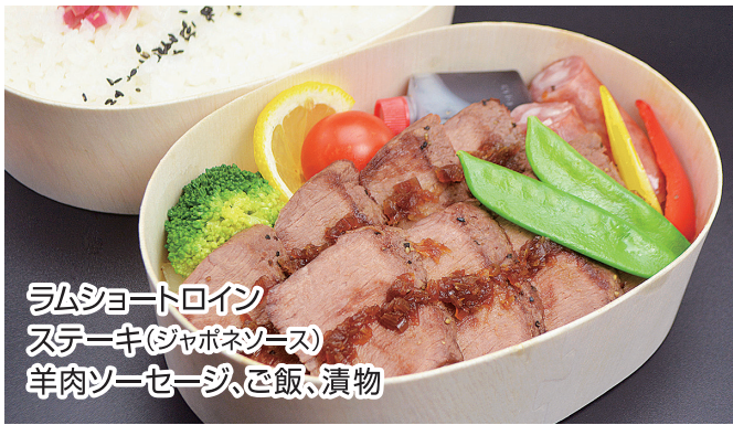
ラムショートロイン ステーキ(ジャポネーズ) 羊肉ソーセージ、ご飯、漬物