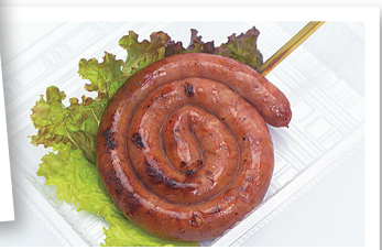
巻き巻きソーセージ